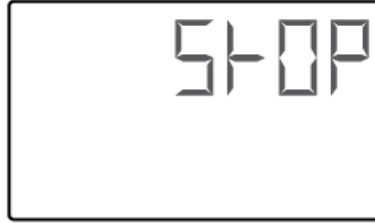
(1 Sek Übergangsblinken)